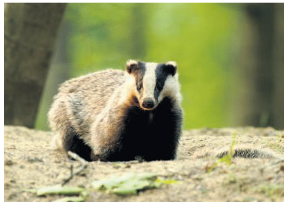
De das is een marterachtige, dat is op deze foto goed te zien.