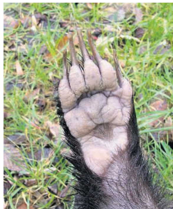
De voorpoot van een das is bedoeld om te graven.